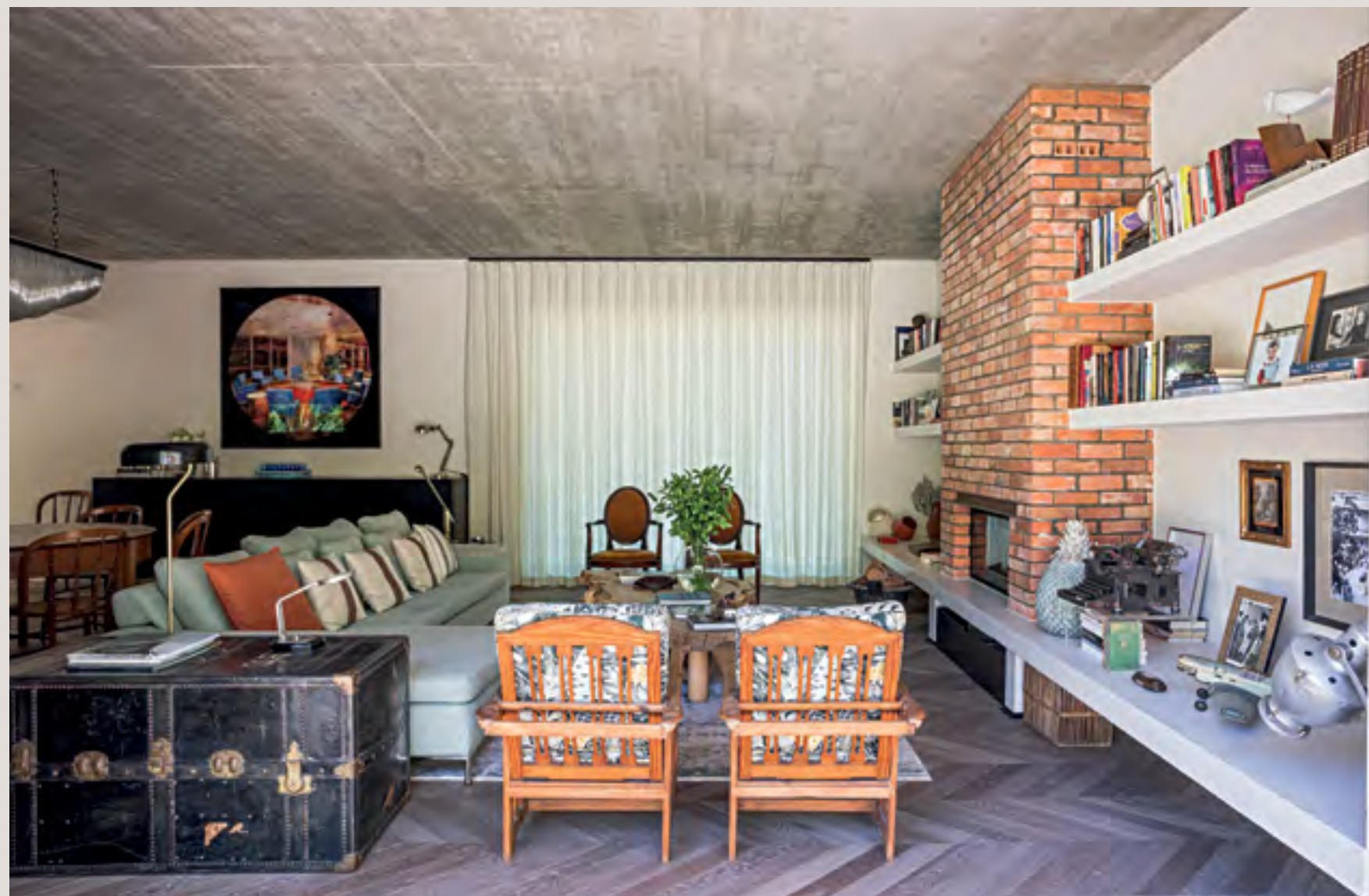
Betão aparente no teto da sala e tijolo de burro na lareira, proveniente da demolição

Esta é a história de uma nova construção dentro do logradouro de um prédio existente. A preexistência, como nos conta o arquiteto Pedro Silva Lopes, "com claro valor arquitetônico, foi valorizada com a manutenção da sua imagem, recuperação dos azulejos, cantarias e guardas da fachada". Por seu turno, a antiga porta de acesso à lavanderia, passou a ser hoje o acesso à garagem, sem qualquer alteração de imagem do espaço público e replicando, de forma exemplar, a preexistência. O edifício que ali morava, foi reformulado, mantendo-se as suas características, mas todo o seu interior foi redesenhado pensado para uma casa familiar distribuída em dois níveis. "Era importante, no âmbito do programa, desenhar uma casa de família, em que os quatro filhos tivessem o seu espaço, tanto individual como social, bem como pensar na criação de áreas sociais que permitissem um uso confortável, no dia-a-dia e, ao mesmo tempo, que este fosse um espaço para receber os amigos, tudo isto tirando partido das vistas sobre o vale de Alcântara", prossegue o nosso interlocutor. A lógica de implantação foi definida pela geometria do terreno, do desenvolvimento altimétrico e da exposição solar e vistas.