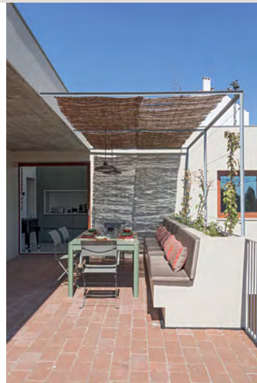
Lá fora, mesa de refeições e cadeirões, da Fermob